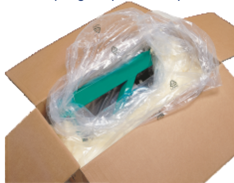
Mod ambalare si transport

Echipare de serie: Comanda la distanta prin cablu Dispozitiv de siguranta Reducator in baie de ulei Motor electric clasa S3 Cadru pregatit pentru suport ancorare